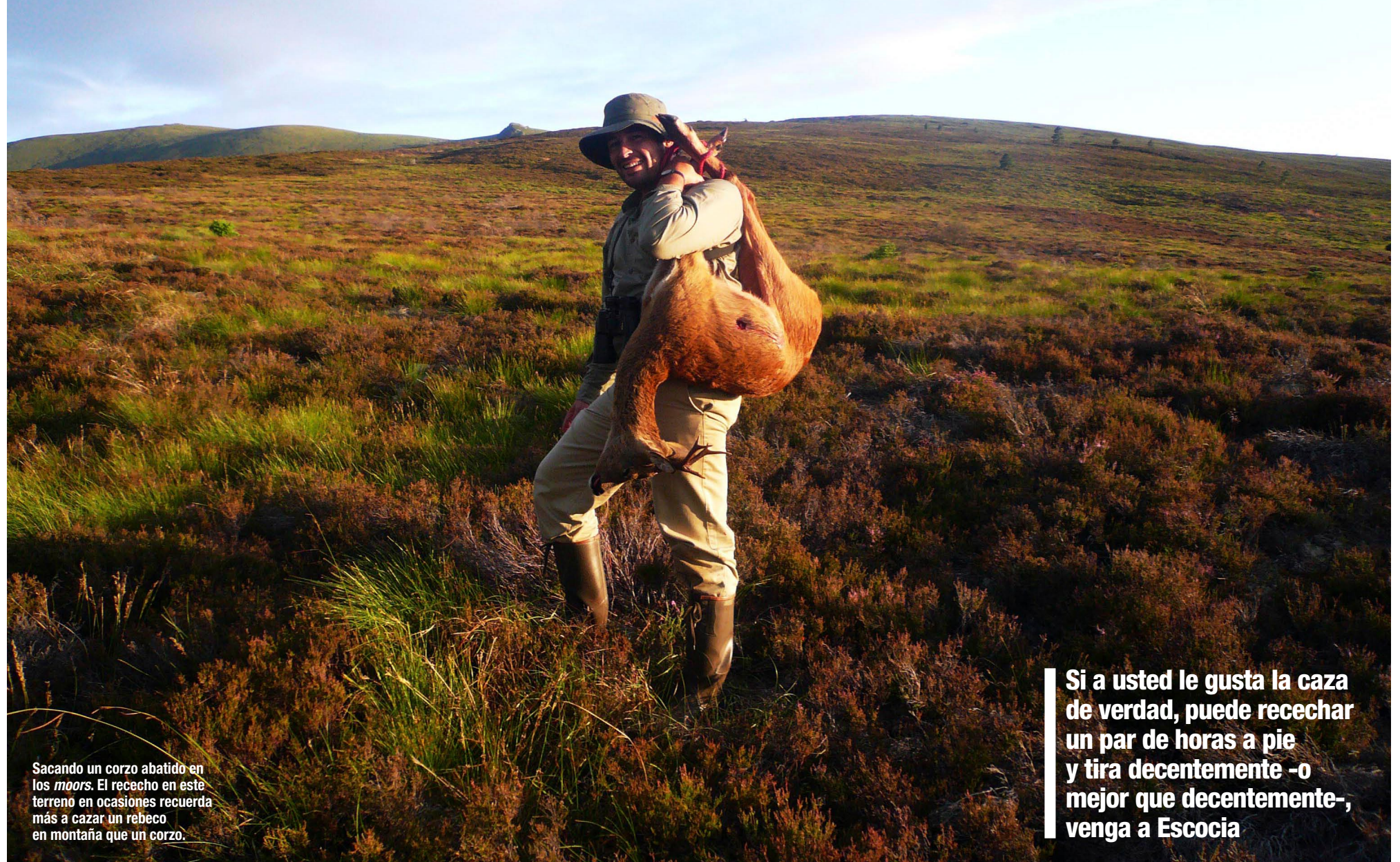
Sacando un corzo abatido en los moors. El rececho en este terreno en ocasiones recuerda más a cazar un rebeco en montaña que un corzo.

Si a usted le gusta la caza de verdad, puede recechar un par de horas a pie y tira decentemente -o mejor que decentemente-, venga a Escocia