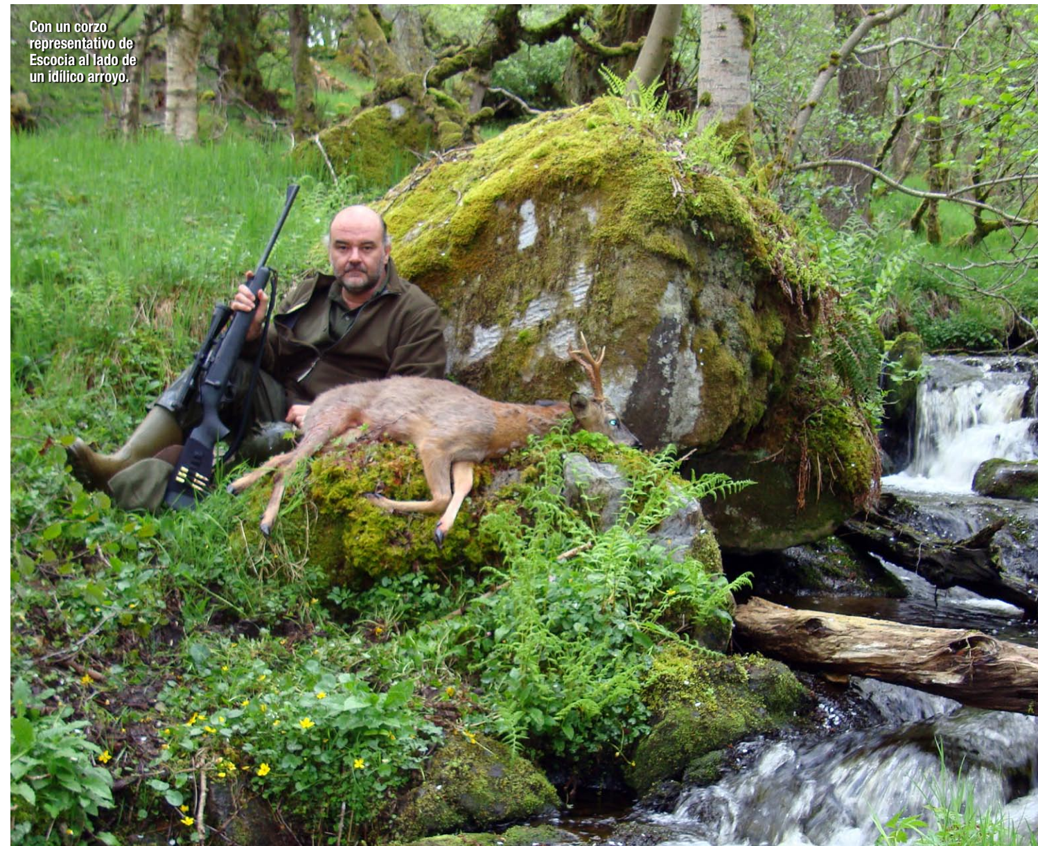
Con un corzo representativo de Escocia al lado de un idílico arroyo.

Lo que sí es importante es llevar su propio rifle y per- →