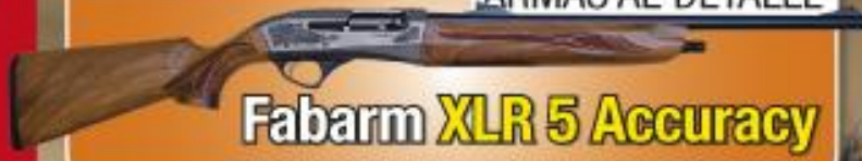
Fabarm XLR 5 Accuracy